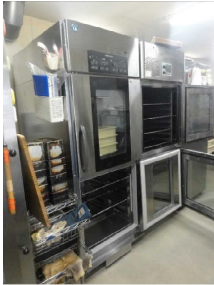
ドウコンディショナーHDC-32D2A3