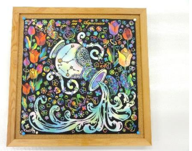
T.Mさん ‘スクラッチアート’