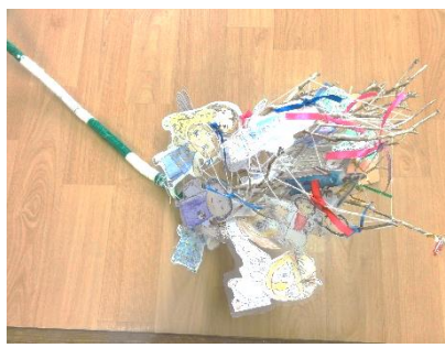
S.Oさん ‘ロックバンド’