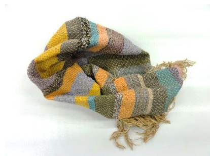
D.Nさん 手織り ‘星’