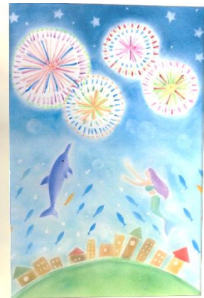
A.Nさん ‘花火とマーメイド’