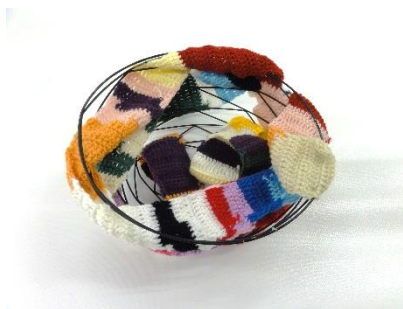
M.Kさん 編み物 ‘虹’